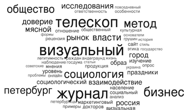
Рисунок 3. Поисковые запросы посетителей сайта журнала «Телескоп»

средством запросов в поисковых системах. Наиболее часто используемыми системами поиска являются Google и Яндекс: доля визитов от общего числа всех посещений сайта составляет 31,4 % и 24,5 % соответственно. Интересы данной группы пользователей может характеризовать частотный анализ поисковых запросов. На рисунке 3 наглядно представлены наиболее часто встречающиеся отдельные слова поисковых фраз (раз-